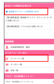
スマートフォン版