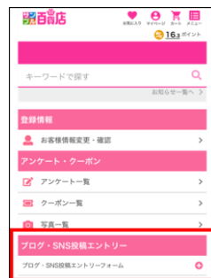
スマートフォン版