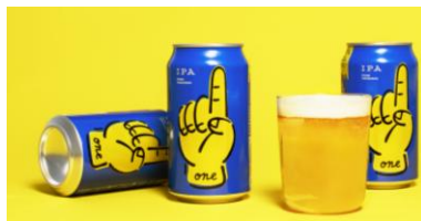
ONE REVO BREWING