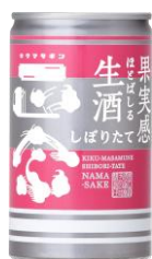
キクマサギン生酒缶 菊正宗酒造