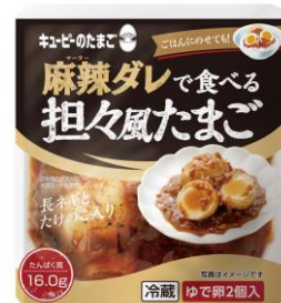
キューピーのたまご 麻辣ダレで食べる 担々風たまご キューピー