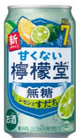
甘くない檸檬堂 無糖レモンとすだち コカ・コーラボトラーズジャパン