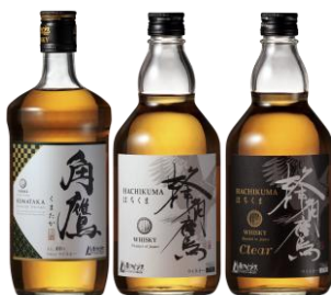
角鷹シリーズ 徳岡