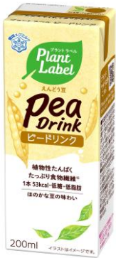
Plant Label Pea Drink