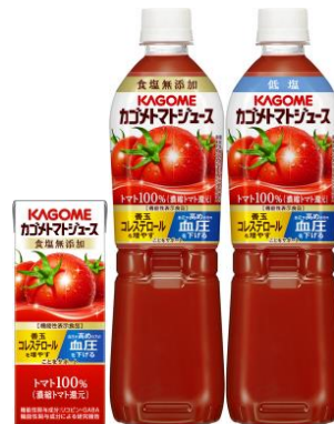
カゴメトマトジュース 食塩無添加