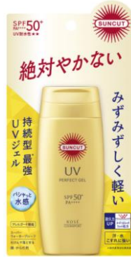
サンカット® パーフェクトUV ジェル