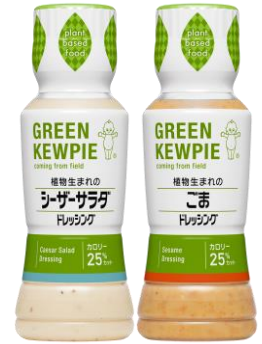
GREEN KEWPIE 植物生まれのシーザーサラダ ドレッシング