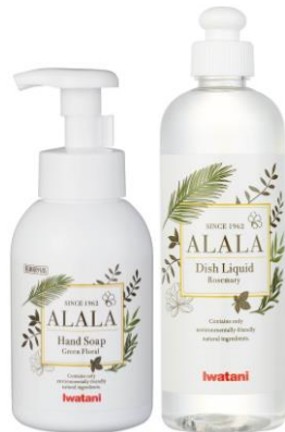
ALALA (アララ) シリーズ