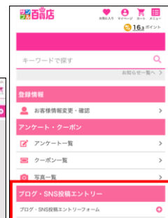
スマートフォン版